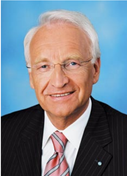
DR. EDMUND STOIBER, MdB

Das Interregnum ist beendet: Seit dem 22. November hat Deutschland wieder eine handlungsfähige Regierung. Bedeutsam ist dabei vor allem, dass es nun wieder eine unionsgeführte Regierung in unserem Land gibt. Denn Deutschland braucht eine starke Regierung, die auf der Grundlage klarer Werteorientierung eine berechenbare Politik macht. Eine Politik, die entschlossen die wichtigsten Probleme unseres Landes angeht: Arbeitslosigkeit und öffentliche Verschuldung. Eine Politik, die sich den gewaltigen Herausforderungen der Zukunft gewachsen zeigt. Das ist die Chance des Neubeginns.