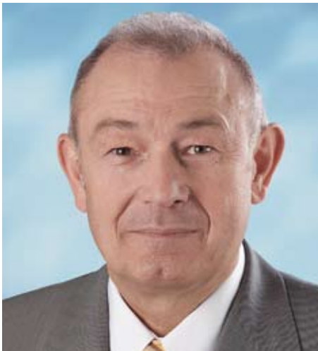
DR. GÜNTHER BECKSTEIN, MdL